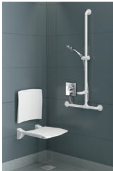
Mise en situation douche avec mitigeur H9633 Réf. DELABIE : DOUCHE HÉBERGEMENT H9633