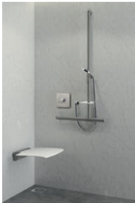
Mise en situation douche avec mitigeur H9631 Réf. DELABIE : DOUCHE H9631