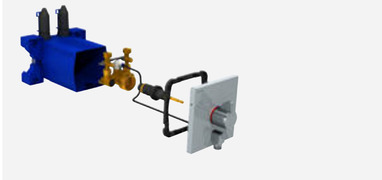
Mitigeur de douche encastrable Réf. DELABIE : H96CBOX + H9633