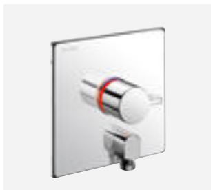
Mitigeur de douche thermostatique encastrable Réf. DELABIE : H9633 + H96CBOX

Illustrations disponibles sur notre site internet delabie.fr , rubrique Presse