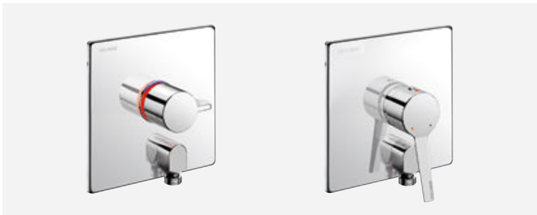
Réfs. H9633 et 2551

DELABIE redessine ses mitigeurs de douche encastrables en les équipant d'un nouveau boîtier d'encastrement 100 % étanche. Ce système innovant s'adapte à de multiples configurations de pose. De par leur conception, ils contribuent tant à la sécurité des patients qu'à la prévention des infections nosocomiales et au confort général.