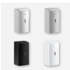
Design : disponible en 4 finitions