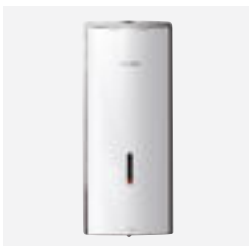
Distributeur de savon liquide électronique

Nouveau distributeur de savon automatique