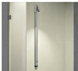
Exemple d'installation, colonne de douche automatique SPORTING 2 SECURITHERM Réf. 714900

Illustrations disponibles sur notre site internet delabie.fr , rubrique Presse